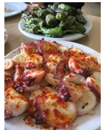
pimientos del padrón y pulpo a feira con cachelos

Aktuelle Termine - ¡Las fechas previstas que nos hacen mucha ilusión!