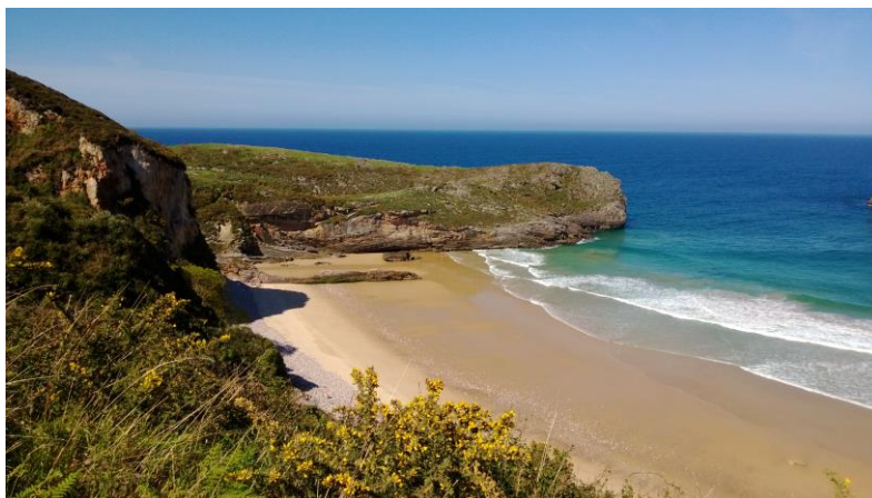
la costa asturiana