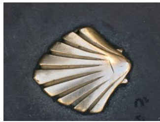
la vieira o concha del peregrino del Camino de Santiago