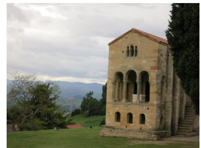
Santa María del Naranco