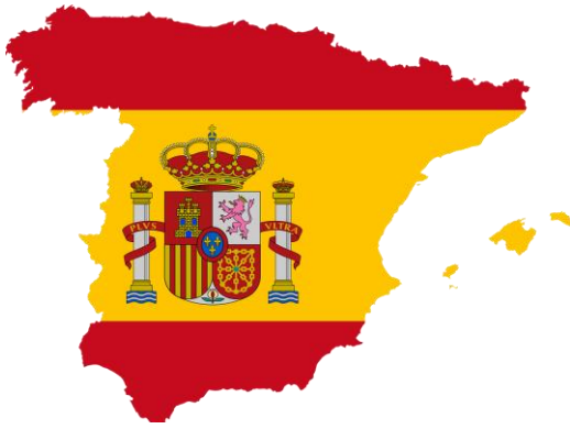
Spanien: Land und Flagge