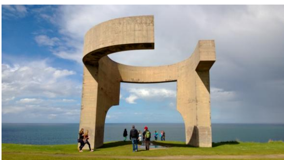
Elogio del Horizonte (Lob auf den Horizont) Eduardo Chillida, escultor vasco.

No podrás descubrir nuevos océanos si no tienes el coraje de perder de vista la costa. - André Gide escritor francés